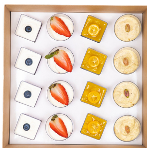
SWEET DESSERT SMART BOX