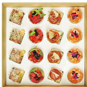
TAPAS №4 SMART BOX