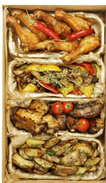
MAN`S PARTY BIG BOX