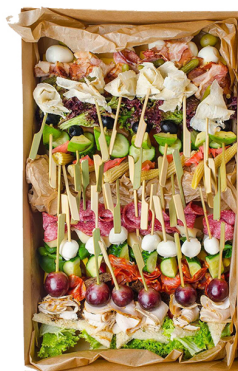
FINGER FOOD №1 BIG BOX