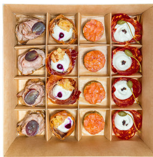
TAPAS №2 SMART BOX