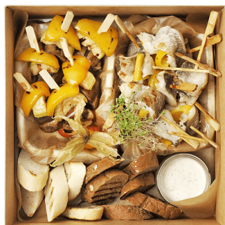
HOT FISH HOTOTЕНИЯ SMART BOX