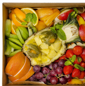
FRUIT SMART BOX