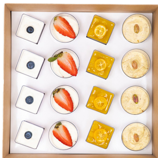
SWEET DESSERT SMART BOX