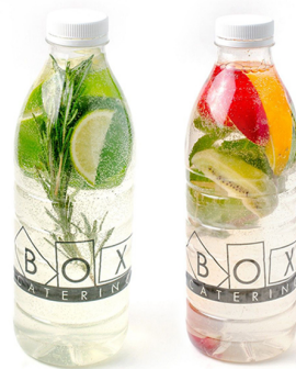
3 ЛИМОНАДА ЛАЙМ-РОЗМАРИН 3 ФРУКТОВЫХ ЛИМОНАДА