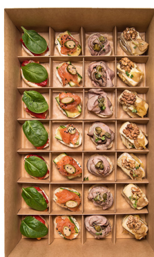
BRUSCHETTA BIG BOX