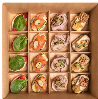
BRUSCHETTA SMART BOX