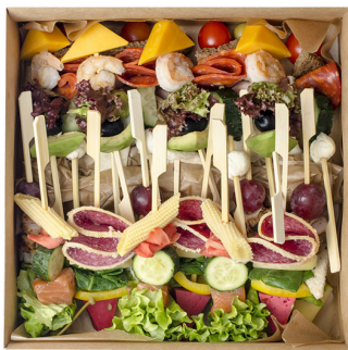
FINGER#1 SMART BOX