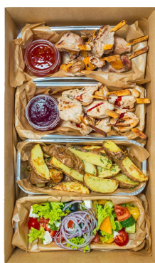
HOT MEAT XL BIG BOX