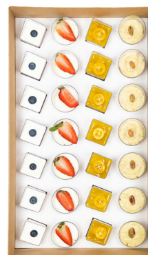
SWEET DESSERT BIG BOX