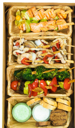
HOT FISH BIG BOX