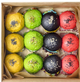
MINI BURGER SMART BOX