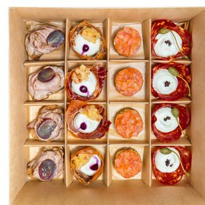
TAPAS №2 SMART BOX