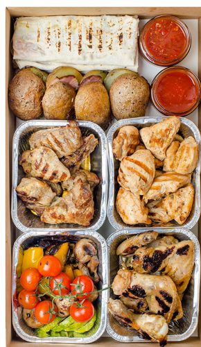
HOT FINGER SMART BOX