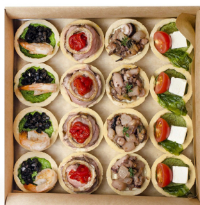
КИШ ЛОПЕН №1 SMART BOX