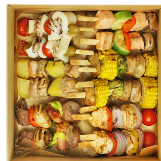
HOT FINGER SMART BOX