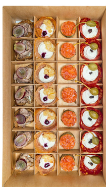
TAPAS №2 BIG BOX