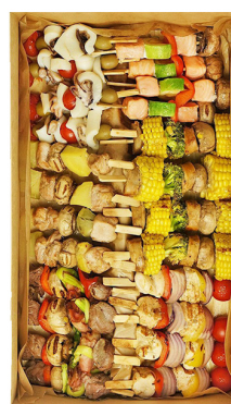
HOT FINGER BIG BOX