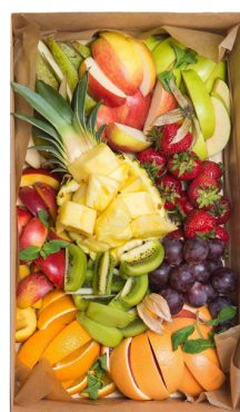
FRUIT BIG BOX