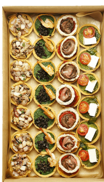
КИШ ЛОПЕХ №1 BIG BOX